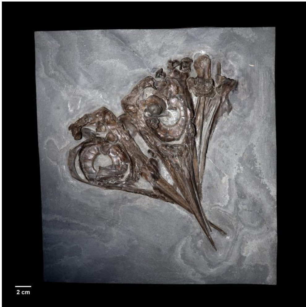
Schädel eines juvenilen Ichthyosauriers in Dorsalansicht, geborgen und präpariert Juli/August 2019