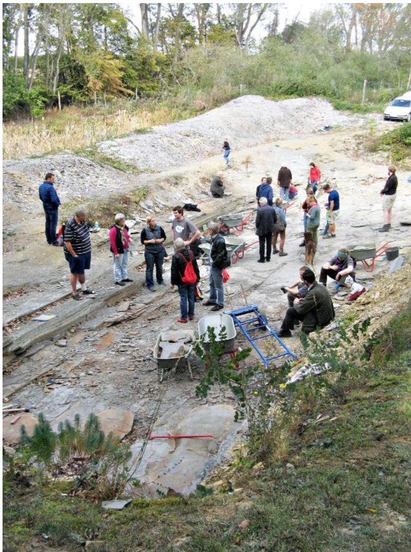
Knapp 400 Besucher kamen zum Tag des Geotops am 15.09.2019 zum Geopunkt Schandelah

Mehrfach im Jahr fanden an der Grabung verschiedene Aktionen statt und die interessierte Öffentlichkeit konnte aktive Grabungstage miterleben. Hierzu zählt besonders der Tag des Geotops am 15. September 2019, an dem knapp 400 interessierte Besucher zur Grabungsstätte pilgerten, was das ungebrochene Interesse der Öffentlichkeit verdeutlicht.