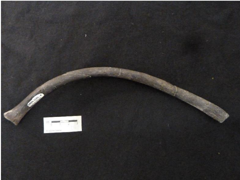
Plesiosaurier-Rippe, geborgen im Juli 2019 am Geopunkt Schandelah

In der Grabungssaison 2019 konnten 188 sammlungsrelevante Fossilien geborgen und dokumentiert werden. Darunter sind Fischreste, komplette Fischskelette, Krokodilzähne, Ichthyosaurierknochen, Insekten, Pflanzenteile und als besonderes Highlight das annähernd vollständige Skelett des 180 cm langen Ichthyosauriers „Creedence“ (s.u.).