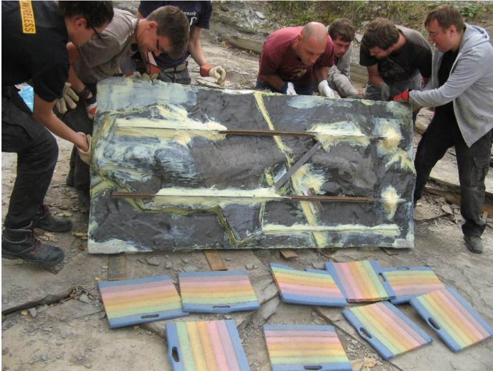
Mit Stahlverstreben verstärkt kann nun die Ichthyosaurierplatte vorsichtig gewendet werden

Ein besonderes Augenmerk wurde wie bereits im Vorjahr auch 2019 auf die Zerkleinerung der in den Vorjahren geborgenen und inzwischen gereiften Borealis- und Siemensi-Geoden gerichtet. Hierbei konnten herausragend gut erhaltene Überreste jurassischer Insekten entdeckt und konserviert werden. Bei einigen dieser Funde dürfte es sich bei zukünftigen Untersuchungen herausstellen, dass es sich um bislang wissenschaftlich noch unbekannte Taxa handelt.