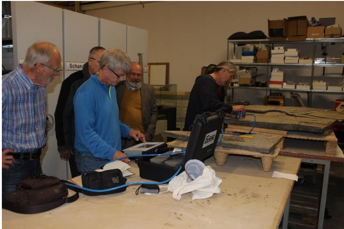
Georadartest in der Paläontologischen Werkstatt

Am 25.09.2019 wurde im Rahmen der Vorbereitung eines Forschungsprojektes mit der Universität Hildesheim und dem Geozentrum Hannover ein Test mit einem neuen Georadar durchgeführt. Mit diesem Verfahren sollen zukünftig größere Fossilien leichter aufspürbar sein.