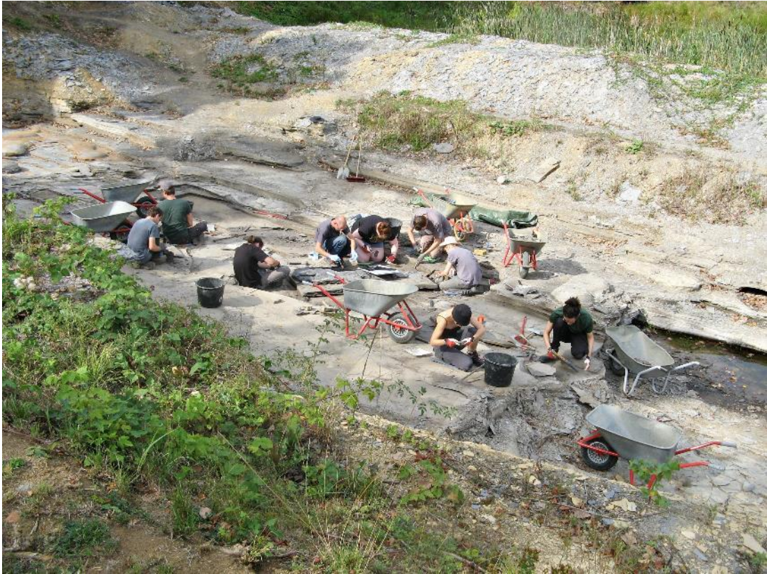
Großflächig und vorsichtig wird das Gestein um den Ichthyosaurierfund herum entfernt, August 2019